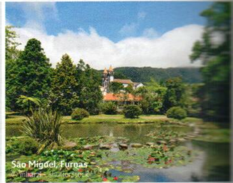
São Miguel, Furnas

Die ideale Variante, um die Azoren kennen zu lernen: die Reise führt Sie zu den bedeutendsten Inseln des Archipels – São Miguel, Terceira, Faial und Pico.