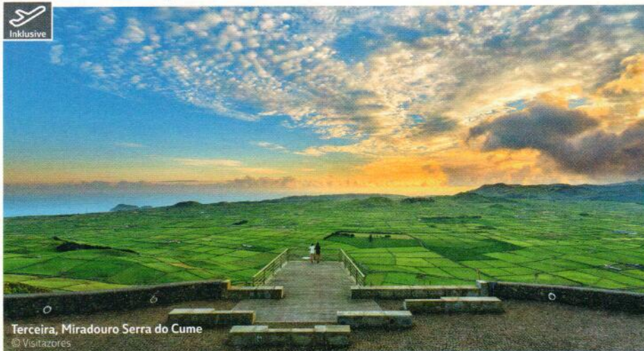
Terceira, Miradouro Serra do Cume